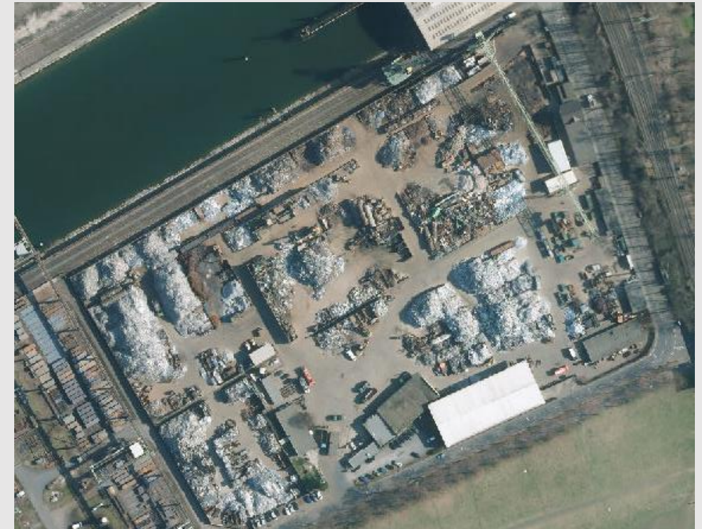
Luftbild der Theo Steil – Niederlassung im Hafen Köln-Deutz